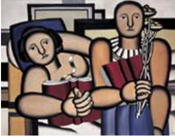
Fernand Léger. La Lecture , 1924.

Proposé dans les collections modernes et contemporaines De février 2007 à juin 2007