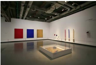
Exposition Yves Klein, salle 13

Proposé dans l'exposition Yves Klein. Corps, couleur, immatériel Du 5 octobre 2006 au 5 février 2007