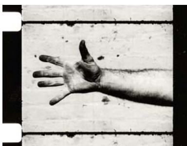
Richard Serra, Hand Catching Lead , 1968

Proposé dans l'exposition Le Mouvement des images De mai 2006 à janvier 2007