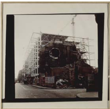
Gordon Matta-Clark. Conical intersect, 1975

• Un conférencier reprend ce travail d'analyse avec les élèves, pour mettre en évidence le parti pris du scénographe face au travail de l'artiste. Cette approche facilite l'appropriation et l'approfondissement des connaissances en alliant le plaisir de la visite.