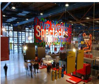
Forum du Centre Pompidou

Proposé dans le Centre Pompidou De septembre 2006 à juin 2007